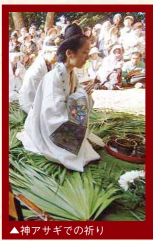
▲神アサギでの祈り

この行事は、国王の年始行事「お水撫で」に、毎年、辺戸大川の水を献上していた伝統行事「大川御水取り」を再現したものです。沖繩の美しい自然と生命の源である水を大事にすると共に、沖繩の平和発展と県民の幸せと健康を願う行われます。平成10年、11年、12年の時を超え復活し、今回は第11回目を迎え、日本水大賞受賞記念として開催いたします。