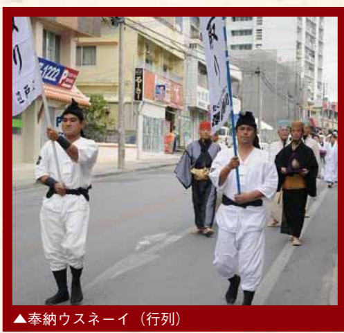
▲奉納ウスネーイ(行列)

首里当蔵町自治会では、日本水大賞受賞記念、開催となる国頭辺戸の「大川御水取り」を受け、御水を首里城へ献上するヌービーの奉納祭を開催いたします。来る年の首里城公園来園者と県民の幸せと健康を、また、首里城及び首里地域の平和と発展を願う行われます。