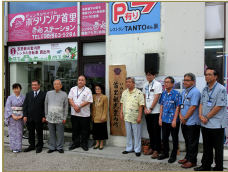
「首里観光案内所」開所式典