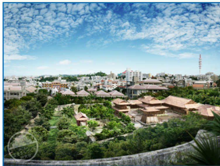
「円覚寺」復元予想図

日時 平成27年7月26日(日) 開会 午後6時00分 会場 首里公民館2階「視聴覚室」