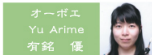
オーボエ Yu Arime 有銘 優