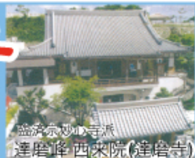
臨濟宗妙心寺派 達磨峰 西来院(達磨寺)

達磨寺(だるまでら): 慶長16年(1611年) 琉球国師 菊間宗瑞卿によって創建された