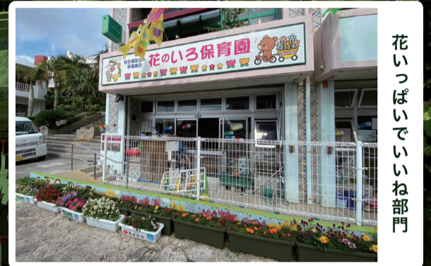
花いっぱいでもいいね部門