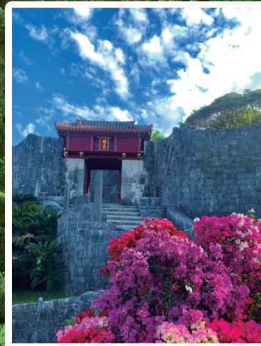
首里城ってやっぱりいいね部門