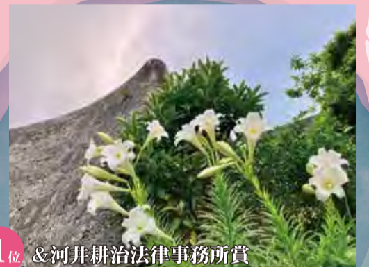
第1位 &河井耕治法律事務所賞 鉄砲百合と首里城城壁～歓会門前にて