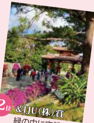
第2位 &IJU(株)賞 緑の中に守禮之邦