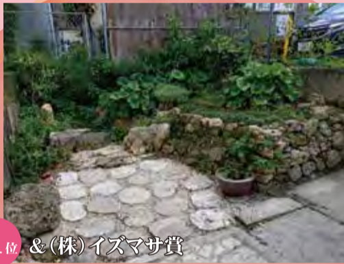
第1位 &(株)イズマサ賞 天王寺井戸の緑化(当蔵町)