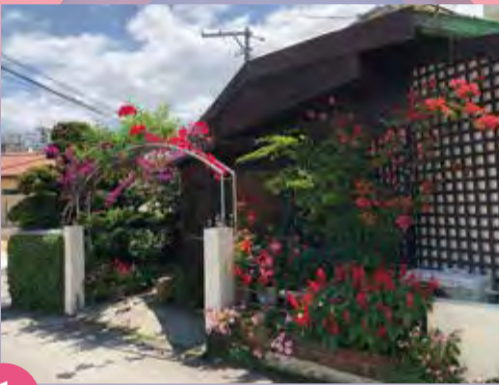
第1位 華やかなエントランス(山川町)