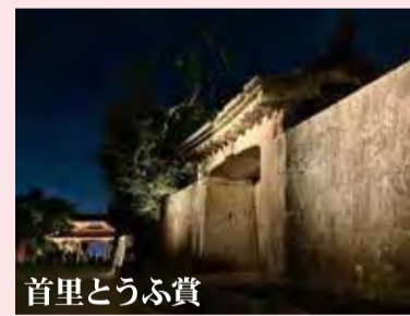
第1位 首里とうふ賞 夜の首里城